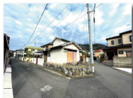
前面道路に下水管あり 敷地内に水路あり（払下げて手続き中）