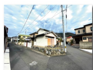
前面道路に下水管あり 敷地内に水路あり（払下げて手続き中）