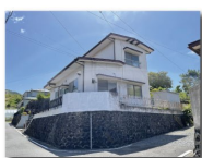
昭和48年4月増築（未登記：1.3㎡）