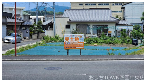
おうちTOWN四国中央店