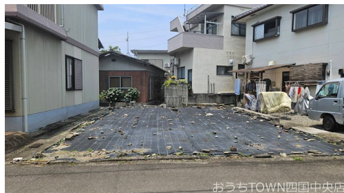
おうちTOWN四国中央店