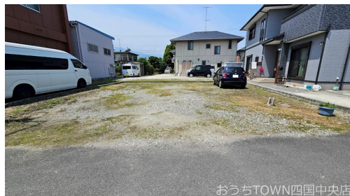
おうちTOWN四国中央店