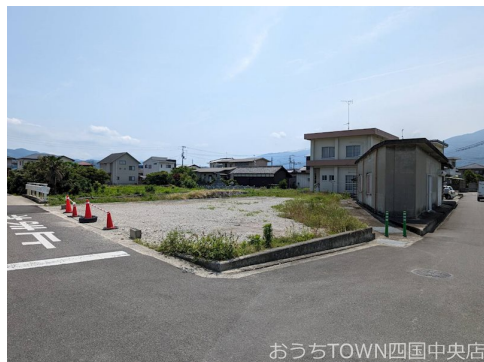
おうちTOWN四国中央店