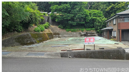
おうちTOWN四国中央店