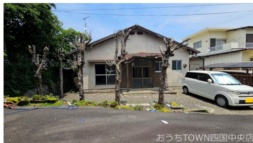
おうちTOWN四国中央店