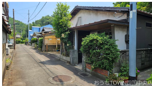
おうちTOWN四国中央店