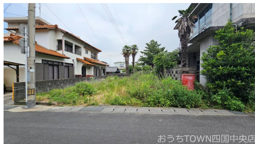
おうちTOWN四国中央店