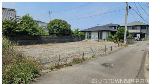
おうちTOWN四国中央店