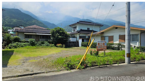
おうちTOWN四国中央店