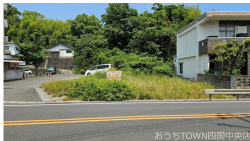
おうちTOWN四国中央店