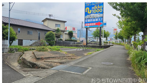
おうちTOWN四国中央店