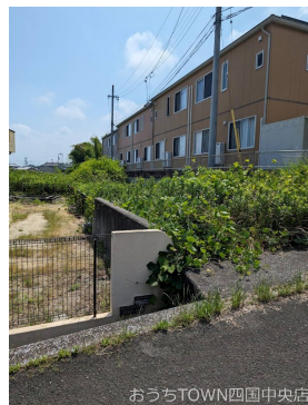
おうちTOWN四国中央店