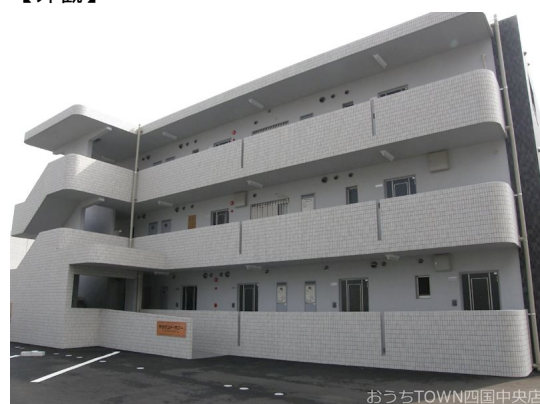
おうちTOWN四国中央店