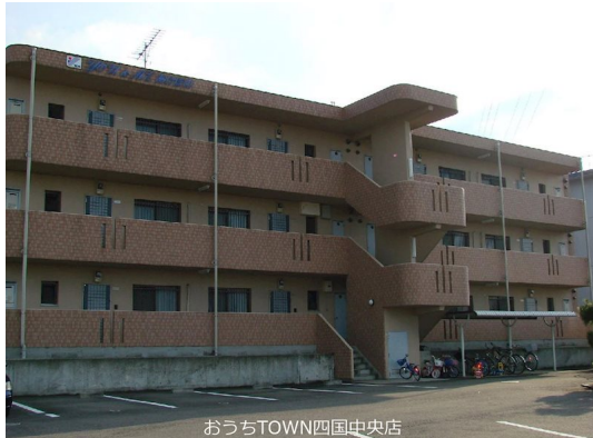
おうちTOWN四国中央店